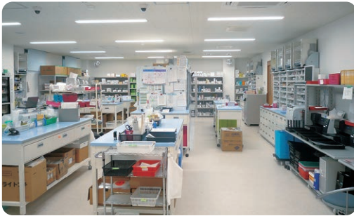
▲1フロアになった調剤室

調剤室では、待ち時間短縮や調剤過誤防止のために関西初の調剤機器などを導入しています。また、お薬をお渡しするカウンターは患者様のプライバシーの保護及び話しやすい環境づくりを目的としてカウンターの仕切りを高くして個室化しています。